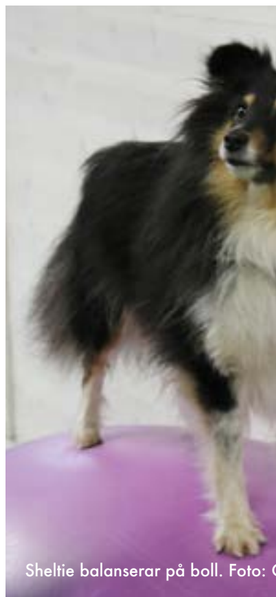
Sheltie balanserar på boll.

muskler. Rund pilatesboll kan vara en utmaning för friska hundar men hunden kan inte stå en bra på en rund boll.