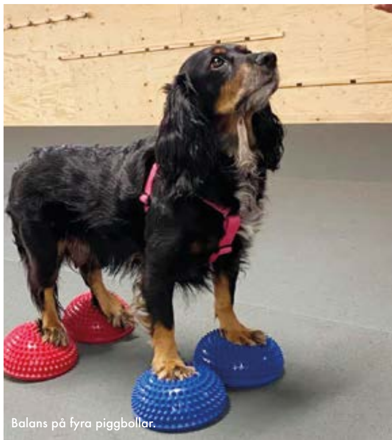
Balans på fyra piggbollar.