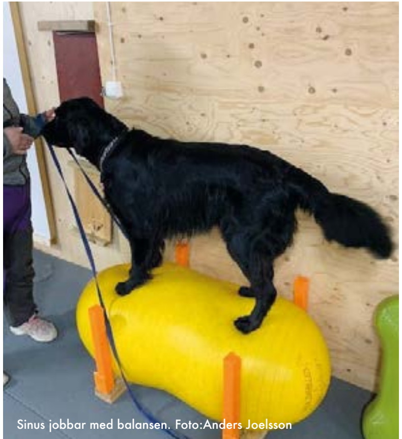
Sinus jobbar med balansen.

lansredskap för att öka utmaningen och få en bättre träning. Man kan till exempel låta hunden jobba i uppförsbacke eller nedförsbacke. I uppförsbacke får hunden jobba med bröstkorg och baksida lår och i nedförsbacke är det ländryggen och buken som jobbar. En muskel som de flesta hundar har problem med och behöver stärka är den stora höftböjaren. Vi har störst kraftutveckling när muskeln jobbar i excentrisk kontraktion, dvs när den sträcks ut och blir längre samtidigt som den kontraheras som vid upp och nedförsbacke. En hund som är svag i frampartiet kan behöva lite extra träning med frambenen på en lägre boll än bakbenen. Avsluta gärna med att låta hunden ligga på bollen medan du sakta gungar den upp och ner.