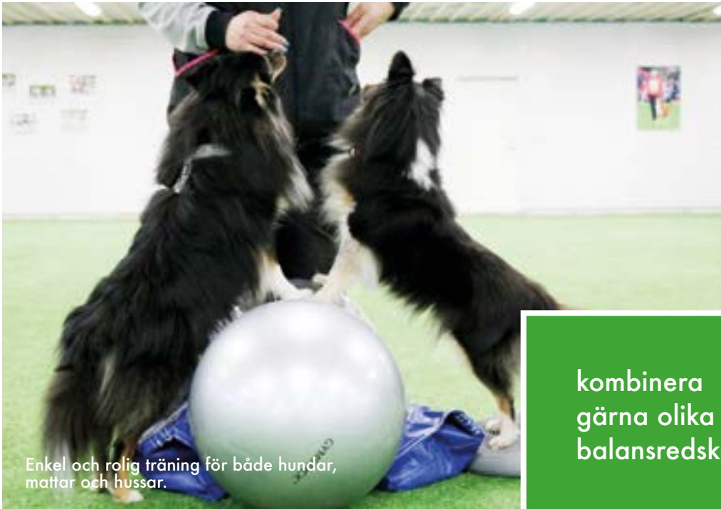
Enkel och rolig träning för både hundar, mattor och hussar.