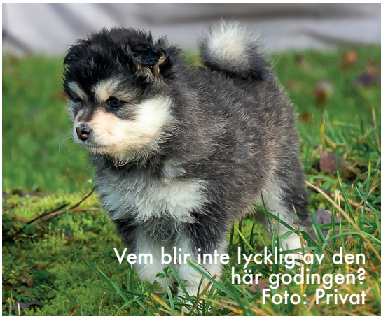
Vem blir inte lycklig av den här godingen?

i förväg, skaffa hundvakt eller kontrollera att resmålet tar emot hundar. Kärt besvär säger jag. Vill man åka utomlands och ta hunden med sig är det ännu mer planering med veterinärbesök och pass för hunden.