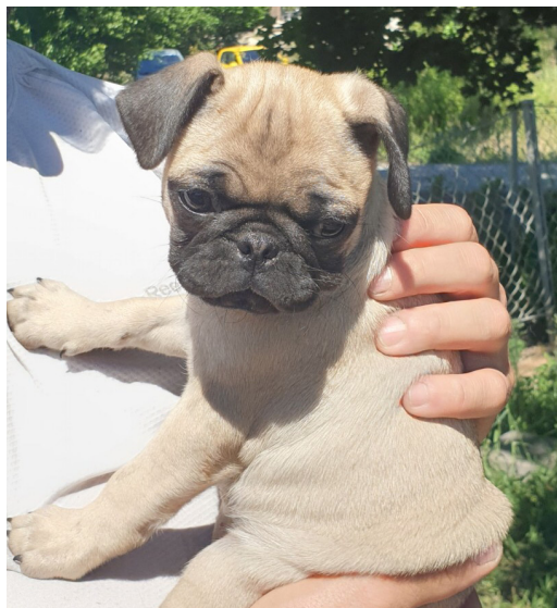
En mops är en mops!