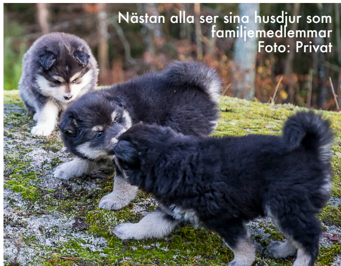
Nästan alla ser sina husdjur som familjemedlemmar