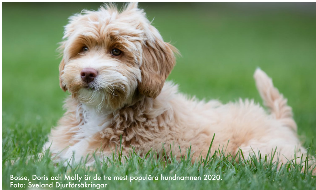
Bosse, Doris och Molly är de tre mest populära hundnamnen 2020.