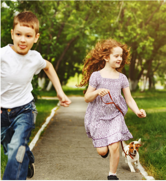
Motionera unghunden? Sunt förnuft bör gälla.