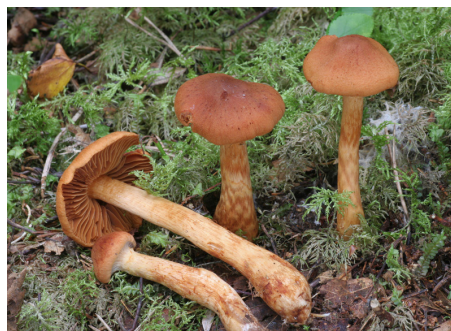
Toppig giftspindling.