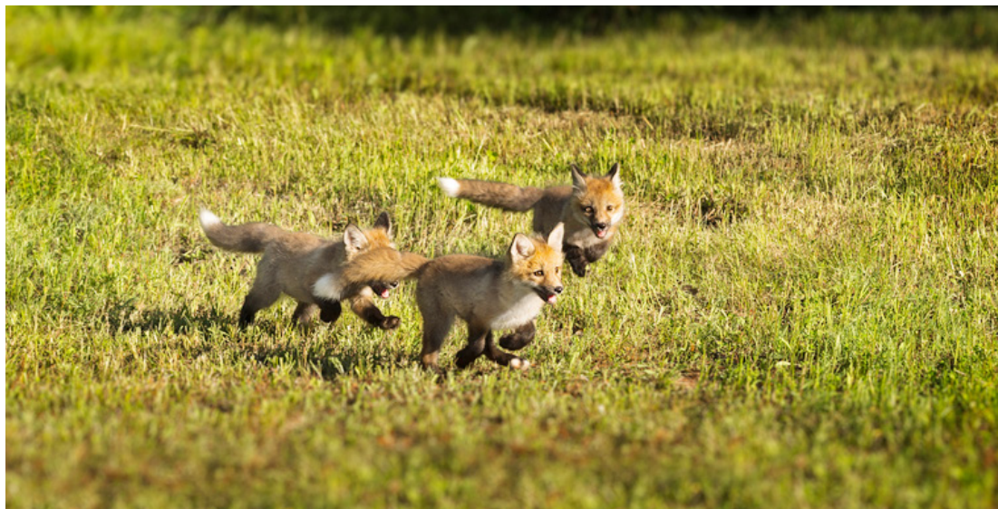
Rävar måste utvecklas fort så de kan klara sig själva och lära sig jaga. De tränas från början med brottnig och att springa .

Jag hittade en intressant läsning Ett examensarbete av Sofia Lovén 2017 på SLU. Jag läser att det är ett omdiskuterat ämne hur mycket en valp eller växande hund börjar röra på sig under uppväxten. En del påstår att hunden bör undvika träning och hårdare fysisk aktivitet innan den är tio månader eller fullvuxen, och att aktiviteter som trappgång bör undvikas. Men på humansidan är hälsofördelarna av fysisk aktivitet hos barn och ungdomar välkända. Så hur påverkas olika delar av kroppen hos vuxna respektive växande individer och vilka långsiktiga effekter fås?