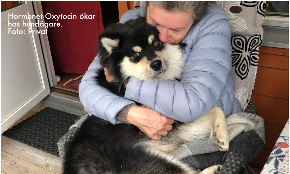
Hormonet Oxytocin ökar hos hundägare.