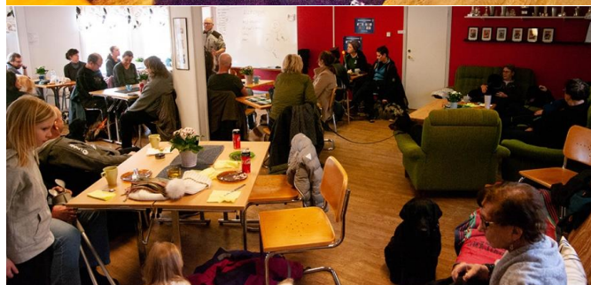
Succé för HundCaféet.

E-post: manadsbladet.sodertalje@svenskahundklubben.se